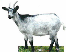
chèvres de Lorraine