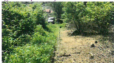
A droite, 5 moutons et une chèvre pendant 15 jours