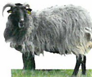
moutons Jaglu (Heidschnucke)