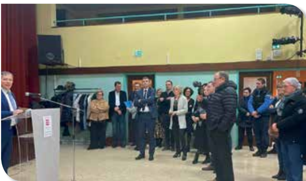
Vœux du Maire