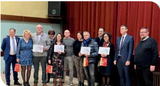
Lauréats maisons fleuries et illuminées

Cette cérémonie s'est clôturée par un moment d'échange et de convivialité.